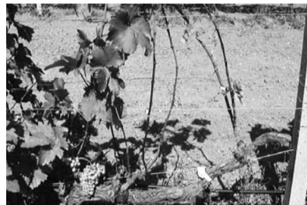
Προσβολή κληματίδων από τον παθογόνο μύκητα της ασθένειας Φόμοψη

Στα φύλλα η προσβολή εμφανίζεται με τη μορφή μικρών, γωνιωδών κηλίδων με ανοικτοπράσινο χρωματισμό στην αρχή που αργότερα γίνεται καστανομελανός. Η παρουσία πολυάριθμων κηλίδων μπορεί να οδηγήσει στη νέκρωση τμημάτων της επιφάνειας του φύλλου ή στην παραμόρφωση