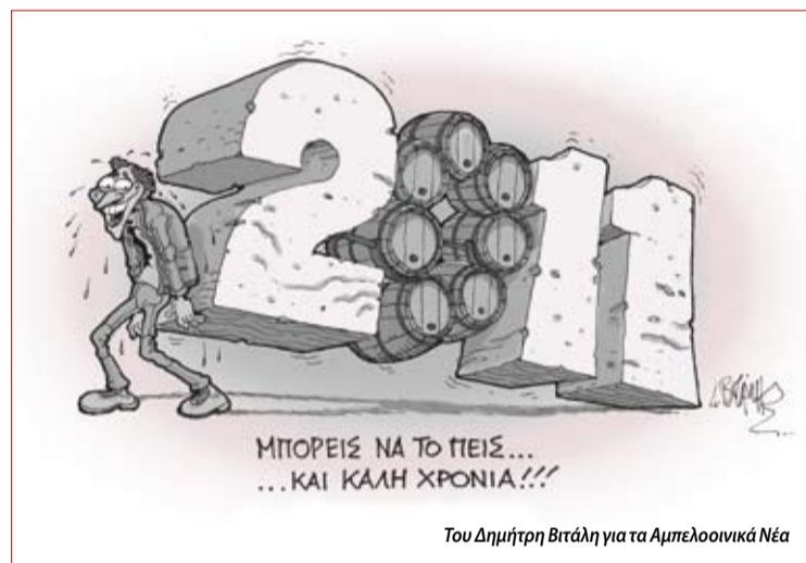
Του Δημήτρη Βιτάλη για τα Αμπελοοινικά Νέα