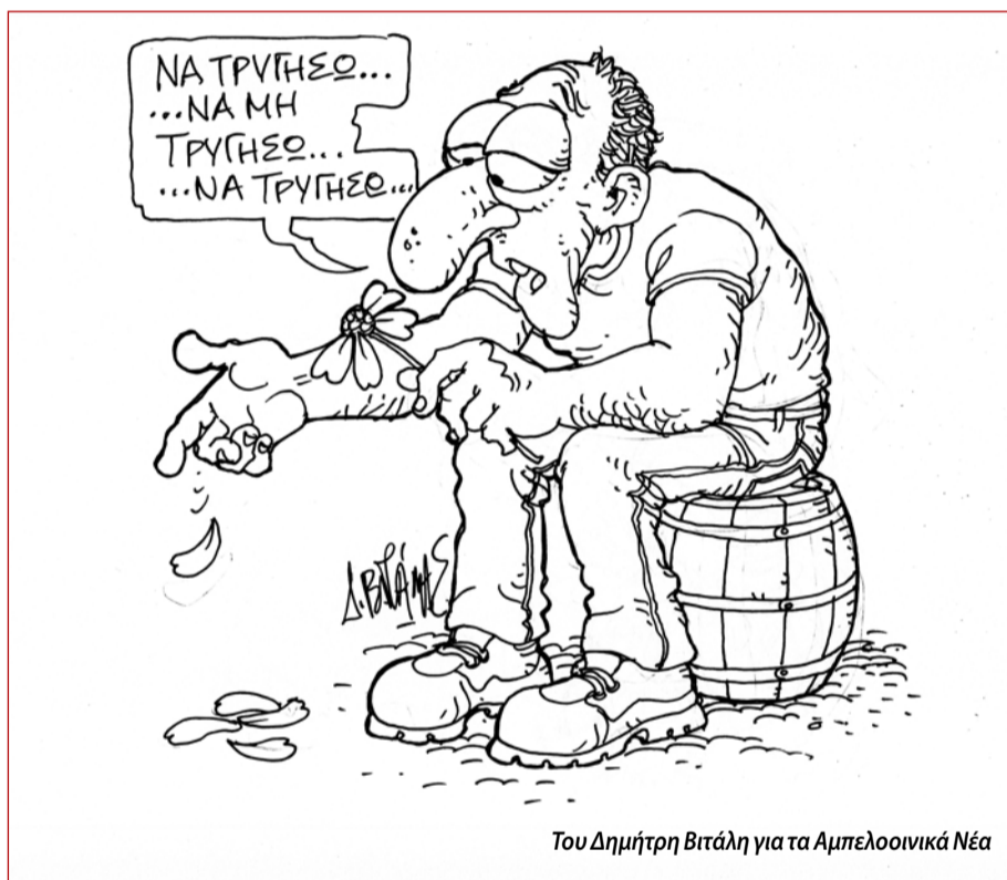
Του Δημήτρη Βιτάλη για τα Αμπελοοινικά Νέα