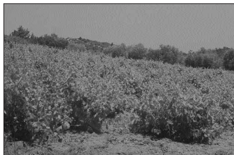
Τυπικός αμπελώνας του Έμπωνα ποικιλίας Αθήρι