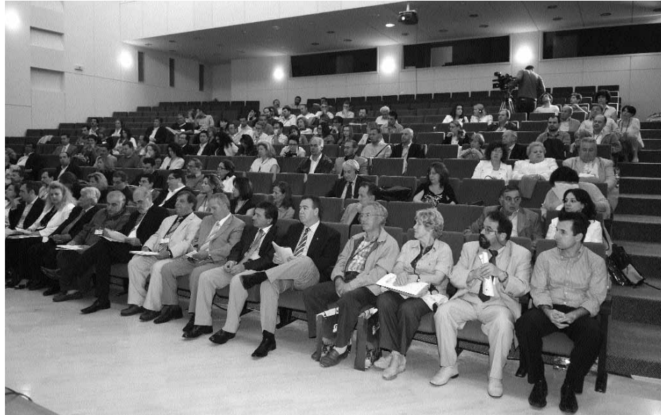
Αποψη του ακροατηρίου στο 1ο Συνέδριο Οινοτουρισμού στη Λήμνο

2η Φάση: Βιβλιογραφική Έρευνα, με την ο-