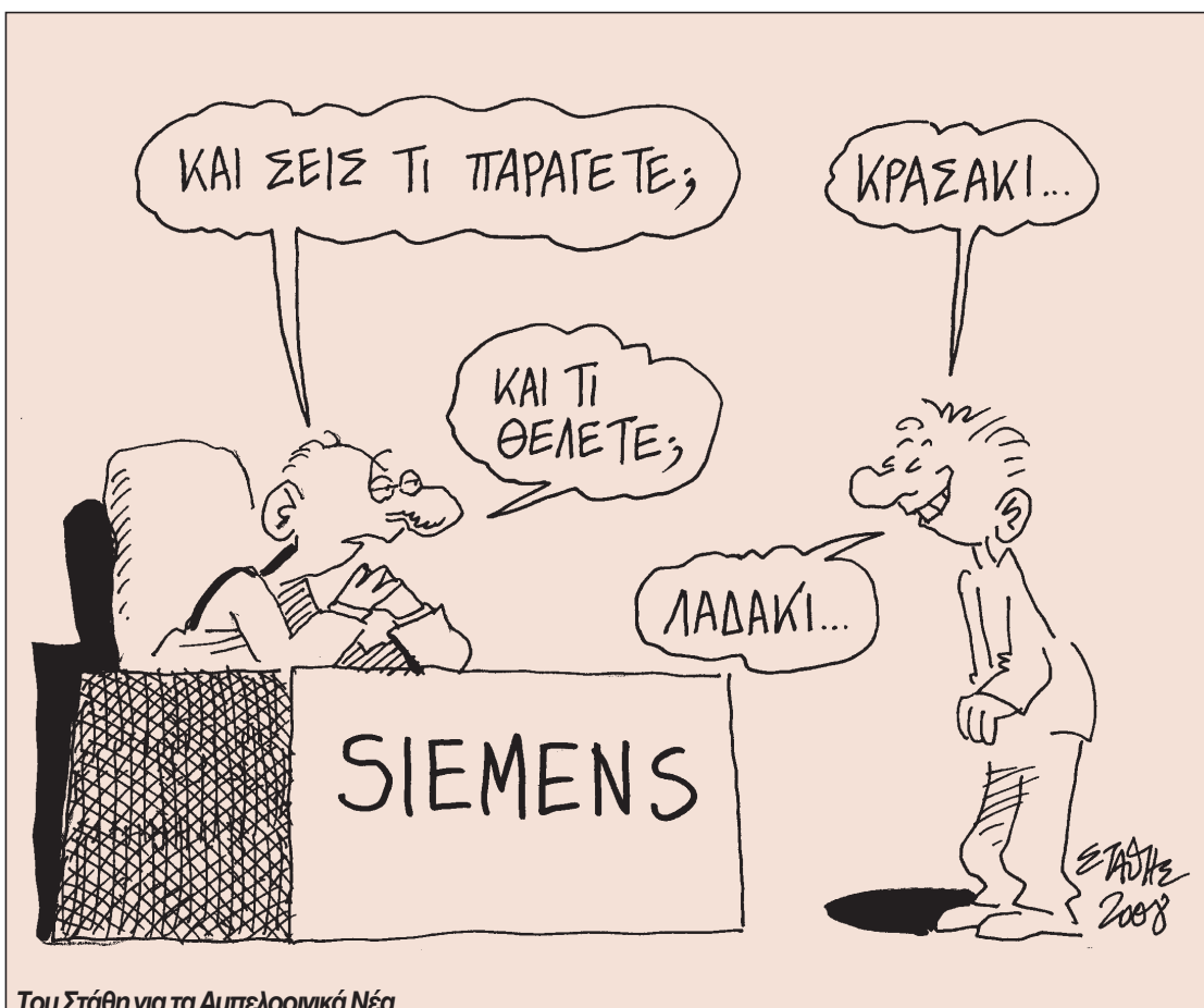
Του Στάθη για τα Αμπελοοινικά Νέα

Σημειώνεται ότι η ΚΕΟΣΟΕ είχε αποστείλει στις αρχές Ιουνίου υπόμνημα προς τον πρωθυπουργό, περιγράφοντας την κατάσταση που επικρατεί στον αμπελοοινικό τομέα και ζητώντας, μεταξύ άλλων, τη σύσταση Οργανισμού Οίνου και διάθεση εθνικών πόρων για την αύ-