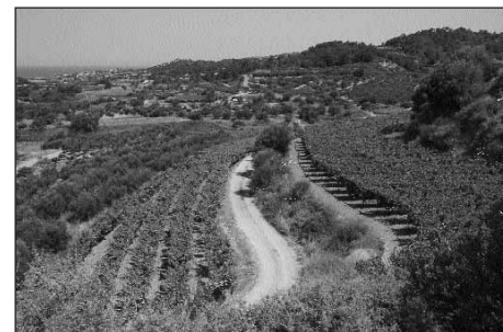
Η εναλλαγή των αμπελώνων με τα ελαιοκλήματα χαρίζουν μια πανέμορφη εικόνα στον επισκέπτη

Στις 31 Μαΐου έγινε από τον γράφοντα στην αίθουσα εκδηλώσεων του Δημαρχείου σχετική ομιλία παρουσία 100 τουλάχιστον αμπελουργών και ακολούθησε ευρεία αναζήτηση, όπου τονίστηκε η έλλειψη πιστοποιημένου πολλαπλασιαστικού υλικού ελληνικών ποικιλιών αμπέλου και οι χαμηλές τιμές διάθεσης των κρασοστάφυλων. Εκείνο που ακούστηκε κατά κόρον ήταν η έντονη επιθυμία των νέων αμπελουργών να χαράξουν μια νέα πορεία επιχειρηματικής καλλιέργειας των οινοστάφυλων, σύμφωνα με τις αρχές της αειφόρου ανάπτυξης, με βιολογικές μεθόδους καλλιέργειας που εγγυώνται την υψηλή ποιότητα των παραγόμενων σταφυλών και δεν έχουν αρνητικές επιπτώσεις στο περιβάλλον.