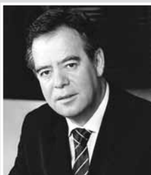
Ο Αλ. Κοντός

Στη νέα κυβέρνηση της ΝΔ, που ορίστηκε μετά την εκλογική νίκη της στις εκλογές της 16ης Σεπτεμβρίου,