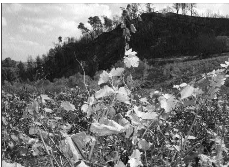
Η φύση επιμένει. Αναβλάστηση αμπελώνα 20 μέρες μετά την πυρκαγιά

νεχίσσαμε στο Δήμο Πύργου με τα χωριά Ελαιώνας κλπ., στο Δήμο Ιαρδανός, με τα χωριά Βροχίτσα κλπ.