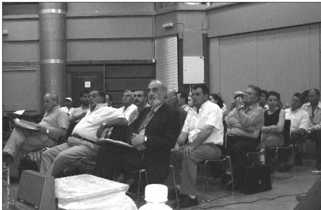
Άποψη από την Γενική Συνέλευση της ΚΕΟΣΟΕ